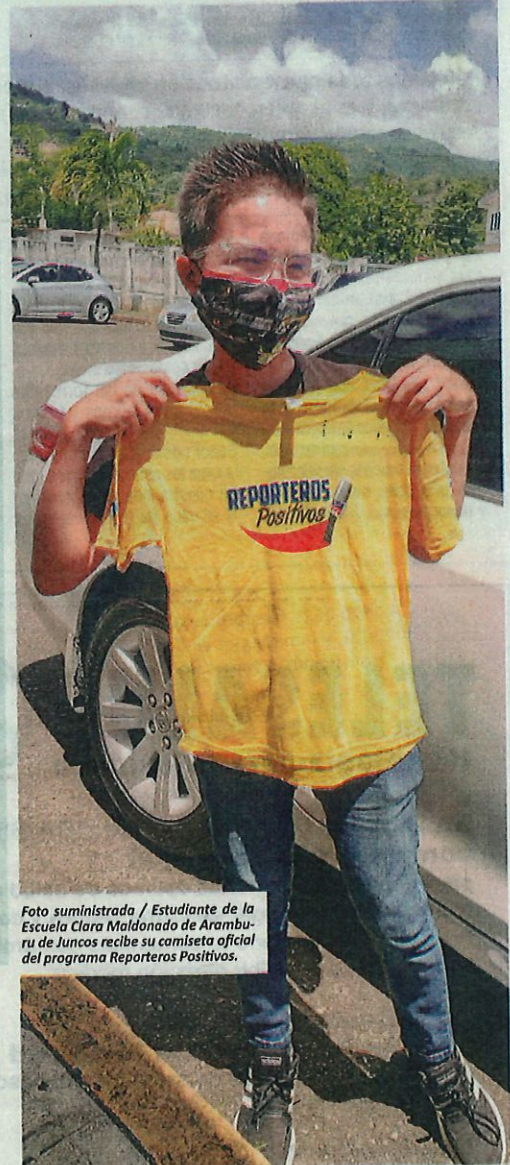
Estudiante de la Escuela Clara Maldonado de Aramburu de Juncos recibe su camiseta oficial del programa Reporteros Positivos.

El programa fortalece las destrezas de liderazgo, compromiso con sus comunidades y manejo correcto del lenguaje dentro de su entorno escolar. A través de seminarios con destacados periodistas de nuestros medios,