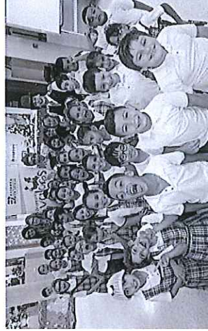
Estudiantes de Juncos, San Lorenzo, Yabucoa y otras que participaron del programa educativo Sembrando Valores de la Alianza para un PR sin Drogas y Fundación Reliable.