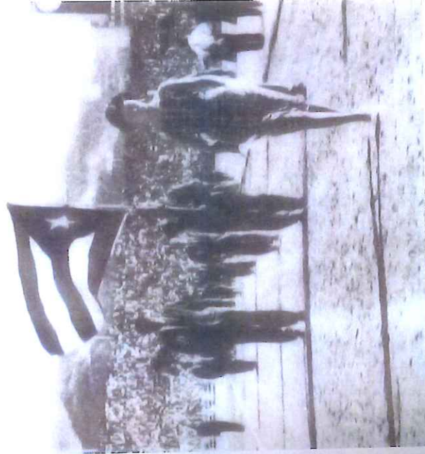
Loyola abanderado de la delegación puertorriqueña.