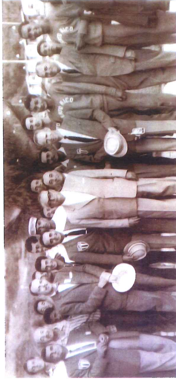
La delegación de Puerto Rico en compañía del presidente venezolano Rómulo Betancourt.

Se compitió en 17 deportes al quedar fuera del programa los torneos de bolos y golf, este de forma definitiva. Las finales fueron 119 y México volvió a dominar en las medallas con un total de 132, llegando en segundo lugar Venezuela que alcanzó las 100 medallas, incluido 35 de oro, Puerto Rico recuperó terreno con relación a la actuación anterior arribando en tercer lugar con 36 medallas en total.