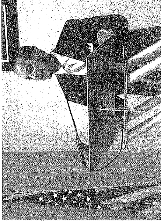
El alcalde de Las Piedras, Micky López, presentó su primer mensaje de logros ante la Legislatura Municipal y resaltó que su enfoque ha sido restablecer las finanzas del ayuntamiento.

Las Piedras, PR —El alcalde del Municipio de Las Piedras, Miguel A. "Micky" López Rivera, aseguró en su primer mensaje de logros ante la legislatura municipal, que ha reducido el déficit presupuestario de $5,183,270.00 a $3,092,057.29 "sin la necesidad de despedir un solo padre o madre de familia". "Al iniciar nuestras gestiones administrativas encontramos una situación difícil pero trabajamos con la reducción de los Puestos de Confianza, reagrupando departamentos. Así como en el cobro de